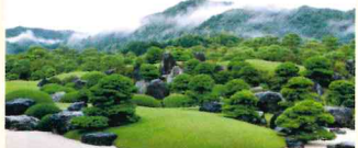
足立美術館 枯山水庭(境港) OP

米国の日本庭園専門誌のランキングで連続日本一に選ばれる庭園と「日本一の横山大観コレクション」と評される足立美術館は、2020年に開館50周年を迎えます。それを記念し所蔵する北大路魯山人の作品だけを展示する「魯山人館」を新設。また、9月11日より所蔵品から100点を厳選・展示する「横山大観の全貌」一名画100点にみる至高の芸術一が開催されます。新たな魅力が加わる美術館を訪れてみませんか。