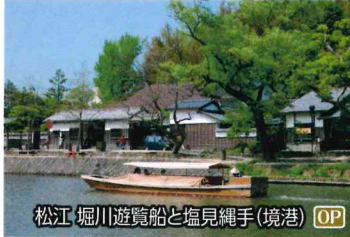
松江・堀川遊覧船と塩見縄手(境港) OP