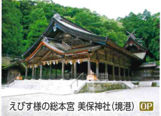
えびす様の総本宮 美保神社(境港) OP